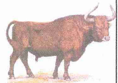
Stier : 185 m. + 1100 kg.....