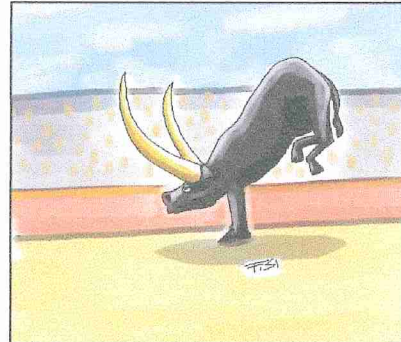
Eerste gekloonde gevechtstier voorgesteld in Spanje